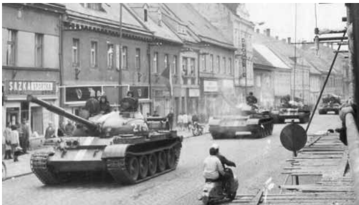
21. srpen 1968