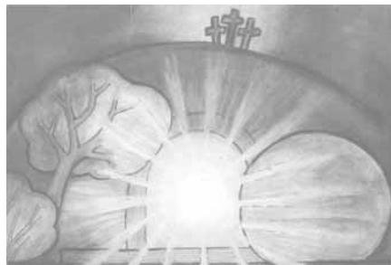
Obrázek si také můžeš vybarvit

Řešení: juiše; Herodes, Možíš, Nábót, Jan, Obed, Pavel, Petr, Jákob, Ezau, had, Jonáš, Lýdie